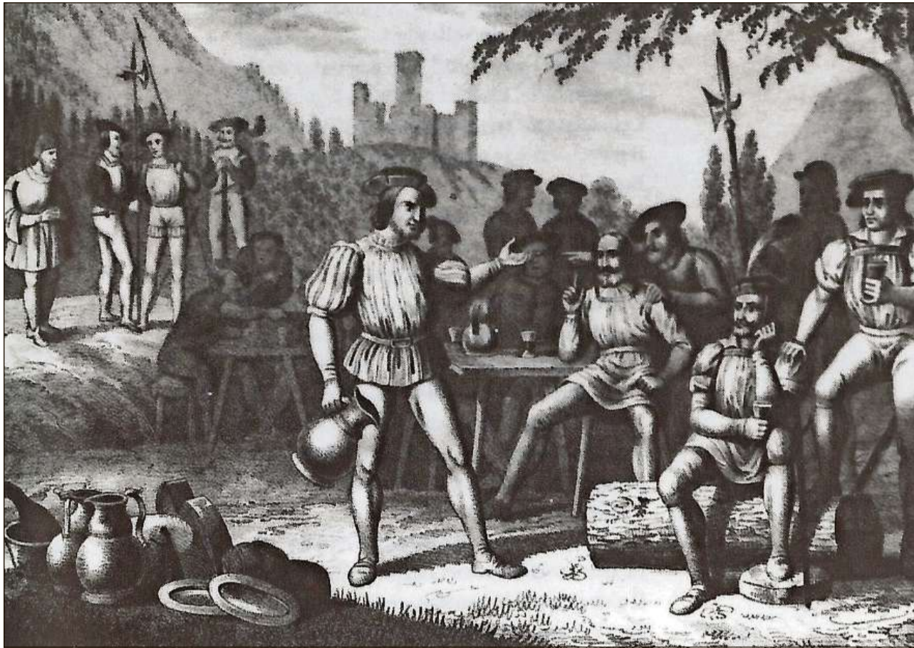
La dretgira nauscha da Valendau. (Maletg dal 19avel tschientaner).